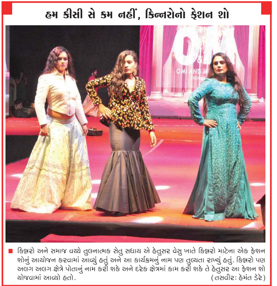
ફિજનો અને સમાજ વચ્ચે તુલનાત્મક સેતુ સંધાય એ હેતુસર વેસુ ખાતે ફિજનો માટેના એક ફેશન શોનું આયોજન કરવામાં આવ્યું હતું અને આ કાર્યક્રમનું નામ પણ તુલ્યાતા રાખ્યું હતું. ફિજનો પણ અલગ અલગ ક્ષેત્રે પોતાનું નામ કરી શકે અને દરેક ક્ષેત્રમાં કામ કરી શકે તે હેતુસર આ ફેશન શો યોજવામાં આવ્યો હતો.

ભયંકર આગ લાગવાને કારણે કેબિનનો સંપૂર્ણ ભાગ આગમાં સ્વાહા એક સ્પાર્ક થયો અને ગણતરીની સેકન્ડમાં આગ ફાટી નીકળી સુરત: શહેરના અંતરિયાળ ગણવામાં આવતા વિસ્તાર એવા અમરોલી ચેકપોસ્ટ પાસે વહેલી સવારે ઊભેલા એક ડમ્પરમાં આગ લાગવાની ઘટના બનતાં અફરાતફરીભર્યાં માહોલ સર્જાયો હતો. થોડી જ વારમાં આગ એટલી બેકાબૂ બની ગઈ હતી કે કેબિનનો આખો ભાગ સળગીને રાખ થઈ ગયો હતો. ડમ્પરના ચાલકે આગ પર કાબૂ મેળવવાનો પ્રયત્ન કર્યો હતો. પરંતુ આગ ભયંકર રીતે પ્રસરી ગઈ હતી. આગનો કોલ મળતાની સાથે જ ફાયર કાફલો ઘટના સ્થળે પહોંચી ગયો હતો. પ્રાપ્ત જાણકારી અનુસાર શનિવારે સવારે 5 કલાકે આઉટર રિંગ રોડ વિસ્તારમાં આવેલી અમરોલી ચેકપોસ્ટ પાસે ઊભેલા ડમ્પર નં.(એમએચ-46 એચ 8027)ના વાયરિંગમાં સ્પાર્ક થયો હતો અને આગ ભભૂકી ઊઠી હતી. ઘટના અંગે ફાયર કંટ્રોલ રૂમને જાણ થતાની સાથે જ કોસાડ ફાયર સ્ટેશનની ટીમ સ્થળ ઉપર પહોંચી ગઈ હતી. ફાયર ઓફિસર પ્રિન્તેશ પટેલે જણાવ્યું હતું કે, ફાયરની ટીમ જ્યારે સ્થળ ઉપર પહોંચી ત્યારે ડમ્પર ભડભડ સળગી રહ્યું હતું. અને આગે એટલું વિકરાળ સ્વરૂપ ધારણ કરી લીધું હતું કે, વાયરિંગ, કેબિન, ટાયરો પણ આગની લપેટમાં સંપૂર્ણ રીતે આવી જતાં તે સળગીને રાખ થઈ ગયાં હતાં. જો કે, અમારી ટીમ તુરંત જ ઘટના સ્થળે પહોંચી ગઈ હતી અને પાણીનો મારો ચલાવીને આગ ઓલવી નાંખી હતી. આ ઘટનામાં કોઈ જાનહાનિ થઈ ન હોવાનું પણ જાણવા મળ્યું છે.