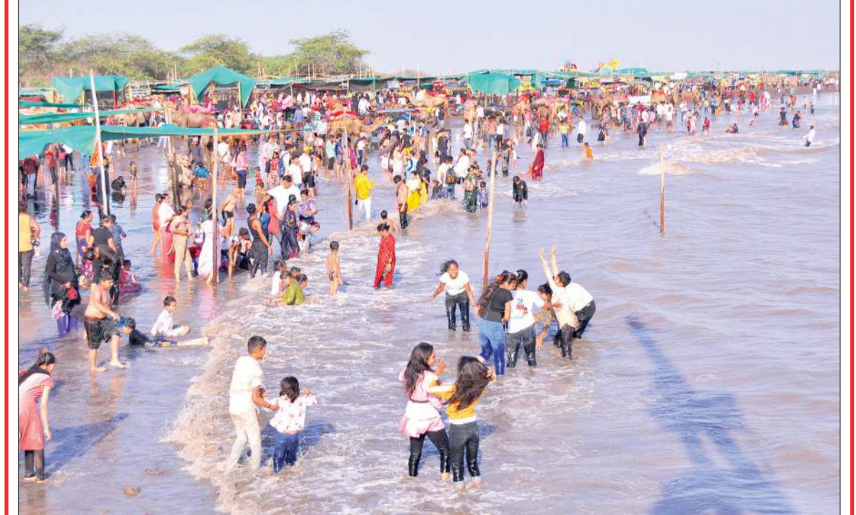
હાલ વેકેશનનો માહોલ છે અને શહેરમાં હાલ ગરમીનો પારો દિવસે ને દિવસે વધી રહ્યો છે. ત્યારે શહેરજનો ગરમીથી બચવા માટે ડુમસ દરિયા કિનારે પરિવાર સાથે ઊમટી રહ્યા છે.